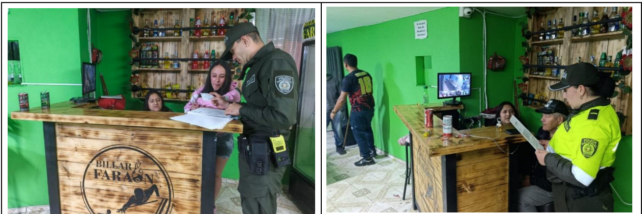
ACTIVIDADES DESPLEGADAS POR LA POLICÍA EN EL SECTOR EL ROSARIO DIAGONAL 16 CARRERA 15

No obstante, se informa que, por parte de este comando, dentro de las actividades propias del servicio de policía, se han venido realizando controles preventivos y verificaciones al establecimiento en mención. En una de las revistas efectuadas, el personal policial realizó la verificación de la documentación requerida para el desarrollo de la actividad económica, así como actividades de control orientadas al cumplimiento de las normas de convivencia y horarios establecidos y se evidencio que el cumple a cabalidad con los mismos